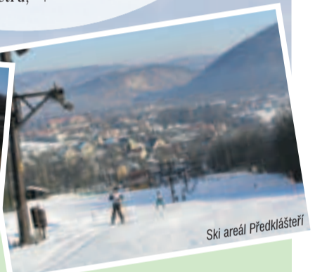
Ski areál Předklášteří