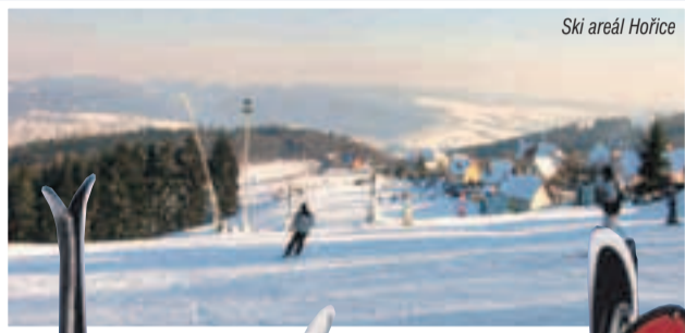
Ski areál Hořice

Plánujete vyrazit na lyže, ale máte na to jen jeden volný den či víkend? Nemusíte jezdit až do Krkonoš či Alp – poradíme vám, kde si zalyžovat přímo na jižní Moravě! Přestože tento region nepatří k vyhlášeným lyžařským oblastem, najde se zde celá řada areálů pro milovníky sjezdového lyžování či snowboardingu. Zalyžovat si můžete dokonce i mezi vinicemi.