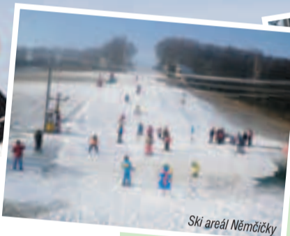
Ski areál Němčičky