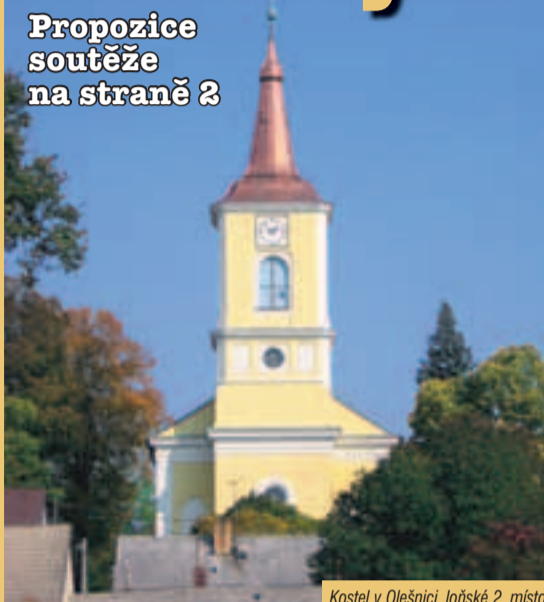
Kostel v Olešnici, laňské 2. místo