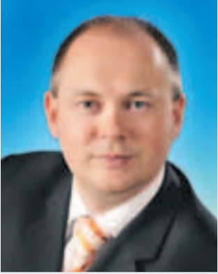
Mgr. Michal Hašek hejtman JMK

Vážení přátelé, těší mne, že Vás mohu touto cestou pozdravit a popřát Vám vše nejlepší do roku 2009 jako hejtman Jihomoravského kraje. Stojíme na počátku roku, jehož dvanáct měsíců před námi leží jako nepopsaný list.