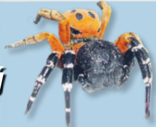
Sameček stepníka moravského