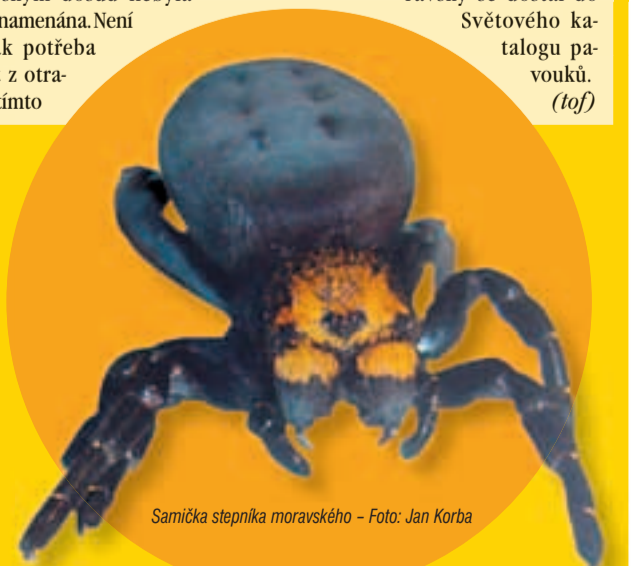
Samička stepníka moravského