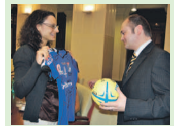
Členky házenkářského klubu HC Britterm Veselí nad Moravou, které

se staly vítězkami Českého poháru, přijal dne 9. března hejtnan Jihomoravského kraje Michal Hašek spolu s radním Jiřím Jandou. Přijetí se zúčastnil také starosta Veselí Jaroslav Hanák.