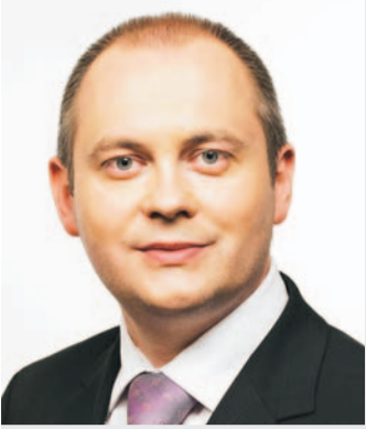
Mgr. Michal Hašek