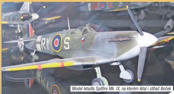
Model letadla Spitfire Mk. IX, na kterém létal i stíhač Boček

„Kokpit letadla jsme museli umět lépe, než věřící odříkat otčenáš. Učili jsme se střílet na pozemní cíle, na pytle i střemhlavé bombardování,“ popisuje okamžiky už pilota 310. čs. stíhací peruti. V Anglii neměl o nešťastné zážitky nouzi - musel například nouzově přistát na poli mezi krávy, když mu vylétla těsně pod hlavami motorů. Na druhý den se mu v jiné mašině přihodilo něco podobného a to ho zase museli odtáhnout traktorem.