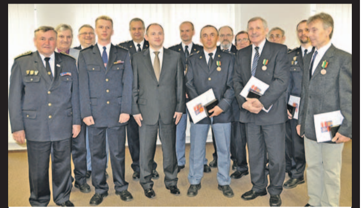
MEDAILLE PRO HASIČE - Během zasedání Bezpečnostní rady kraje, které proběhlo 5. dubna, předal hejtmán Michal Hašek medaile Jihomoravského kraje deseti profesionálním a dobrovolným hasičům za dlouholetý podíl na zajišťování bezpečnosti, ochrany obyvatel a požární ochrany kraje. „U dobrovolných hasičů šlo v některých případech o lidi, kteří se požární ochraně či práci s mládeží věnují několik desítek let, takže to bylo ocenění jejich celoživotního nasazení. Jejich práce si velice vážím, protože kdykoliv se stane nějaká mimořádná událost, jsou to oni, profesionálně i dobrovolníci, kteří jsou jako první na místě,“ vyzdvihl hejtmán. (red)

Více informací o možnosti výcviku na www.flashover.cz . (toř)