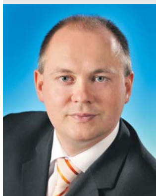
Mgr. Michal Hašek hejtman Jihomoravského kraje

Výjezdní zasedání Rady Jihomoravského kraje ve Znojmě se konalo 21. května – přesně šest měsíců od ustavujícího zasedání krajského zastupitelstva, které nově radní zvolilo do funkcí. Pracovní zasedání se tak stalo i příležitostí k ohlednutí za tím, co bylo za prvního půl roku vykonáno.