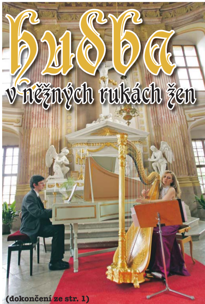
(dokončení ze str. 1)

„Letošní podtitul „Dámy mají přednost“ je možno chápat doslova, každý festivalový koncert bude totiž zahájen reprezentativním dílem některé skladatelky 19. až 21. století. Zřekli jsme se myšlenky uspořádat festival nabízející výlučně hudbu žen, abychom se vyhnutí příliš jednostrannému pohledu. Na festivalu chceme nicméně co nejlépe představit mistrovská díla mezinárodně uznávaných skladatelek a demonstrovat, za co vše vděčí tvůrčím ženám koncertní repertoár dodnes ovládaný muži,“ uvedl Walter Labhart, dramaturg festivalu.