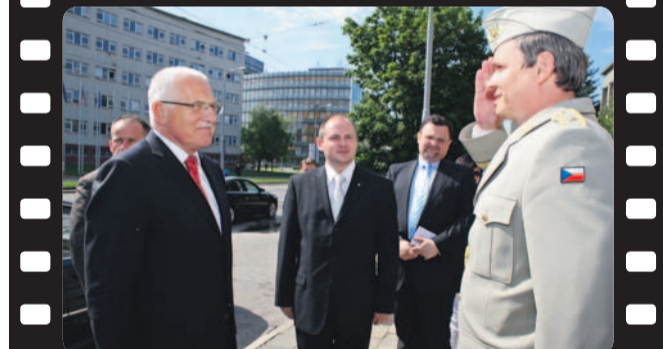
Návštěva brněnské Univerzity obrany a Národního centra ošetřovatelství a nelékařských zdravotních oborů v Brně