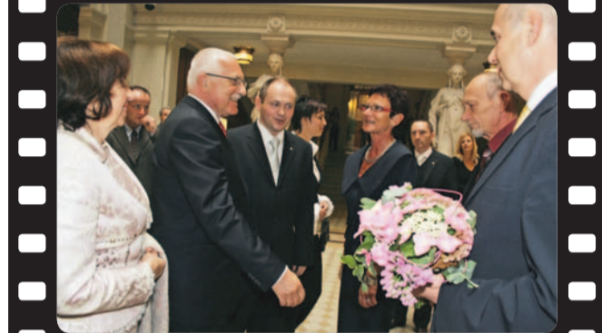
Setkání s nejvyššími představiteli Krajského úřadu Jihomoravského kraje