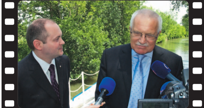
Plavba po Batově kanále z Petrova do Strážnice