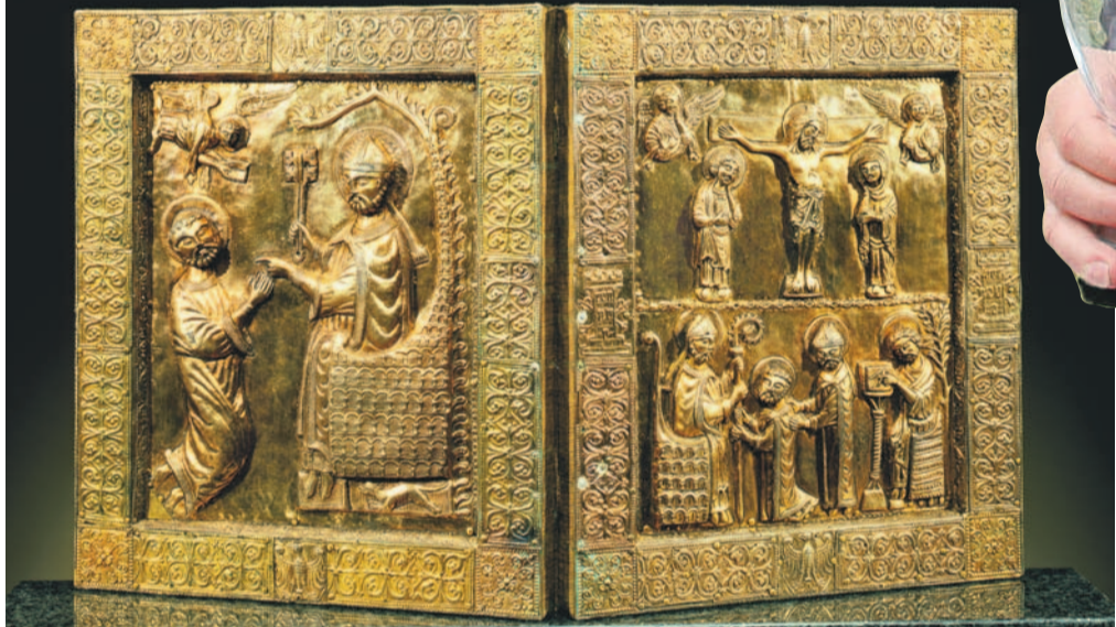
Desky evangelí sv. Marka

V letošním roce se v Cívici Musei di Udine v Itálii uskutečnila rozsáhlá prezentace gotického umění „Skvosty gotiky akvilejského patriarchátu“. Tato výstava, rozšířená o celou řadu předmětů z českých a moravských sbírek, je nyní představena české veřejnosti v Regionálním muzeu v Mikulově v areálu zdejšího zámku.