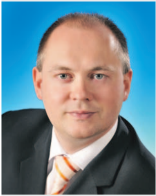
Mgr. Michal Hašek