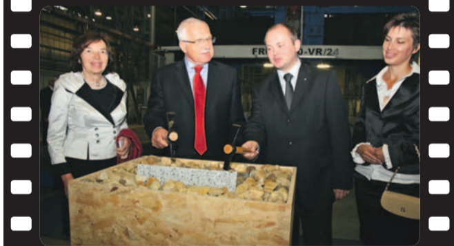
Slavnostní poklepání základního kamene v TOS Kuřim a zakončení prezidentské návštěvy v Tišnově