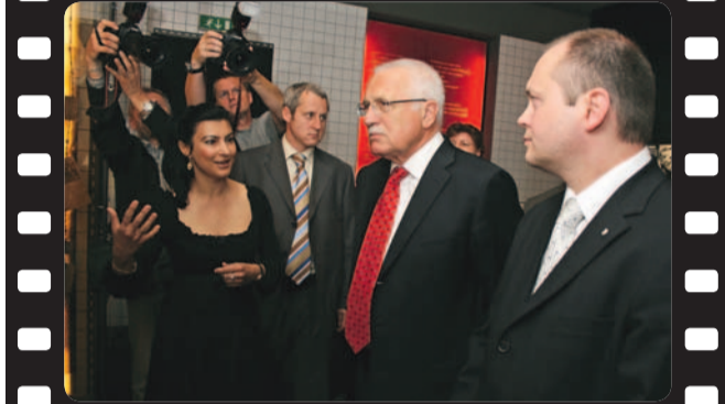
Prohlídka Muzea romské kultury v Brně