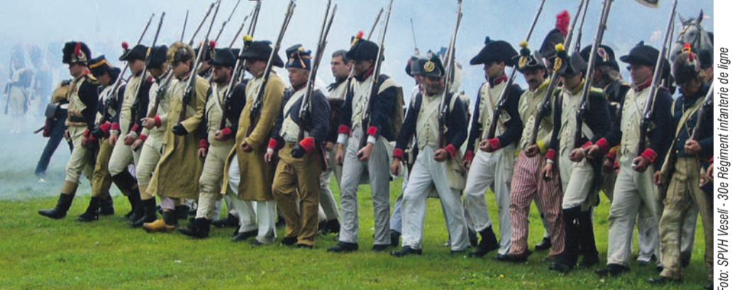
30e Régiment Infanterie de ligne