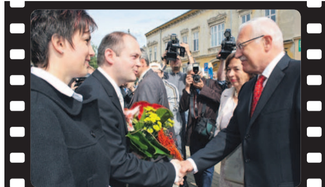
Prezidenta Václava Klause přivítal hejtmán Michal Hašek v Rosicích

První den návštěvy prezidentský pár navštívil Rosice, Masarykův okruh a setkal se představiteli vrcholných institucí justice či rektory univerzit, sídlících v Brně. Dále navštívil Krajský úřad Jihomoravského kraje, brněnskou radnici, Univerzitu obrany či Muzeum romské kultury. Druhý den následovala návštěva Hodonína a zdejších lázní, Moravských naftových dolů a Vesnické památkové rezervace Plíže v Petrově. Specialitou byla plavba po Batově kanále z Petrova do Strážnice, kde si prezident s doprovodem prohlédl Muzeum vesnice jihovýchodní Moravy. Druhý den návštěvy zakončil na zámku v Miloticích. Třetí den prezident zavítal do Jihomoravského inovačního centra v Brně, společnosti TOS Kuřim, navštívil golfový areál Kaskáda a společnost Siemens v Drásově. Návštěvu završila prohlídka cisterciáckého opatství Porta coeli a expozice Muzea Brněnska v Tišnově.