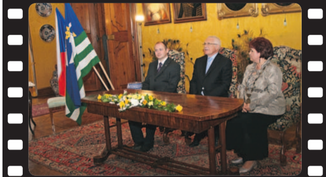
Zakončení druhého dne oficiální návštěvy prezidenta na zámku v Miloticích