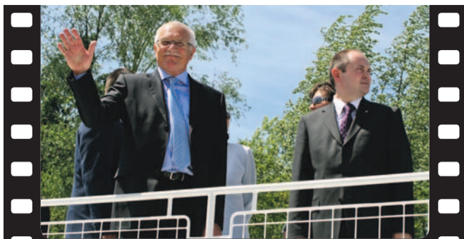
Návštěva Batova kanálu