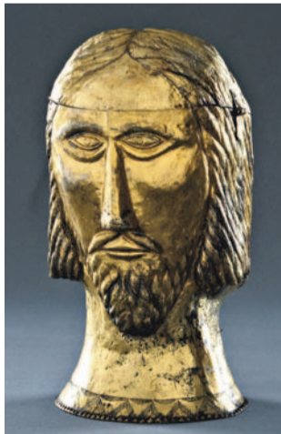
Hlava relikviáře sv. Jakuba

Výstava potrvá do 13. září, více na www.rmm.cz. (tof)