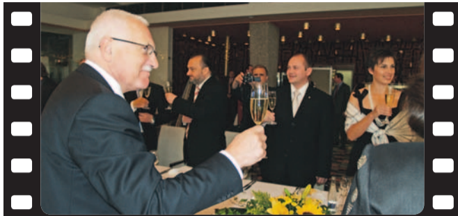
Večeře v hotelu International