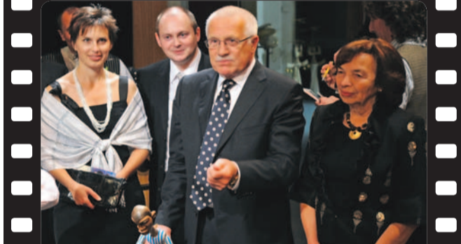
Představení v Loutkovém divadle Radost