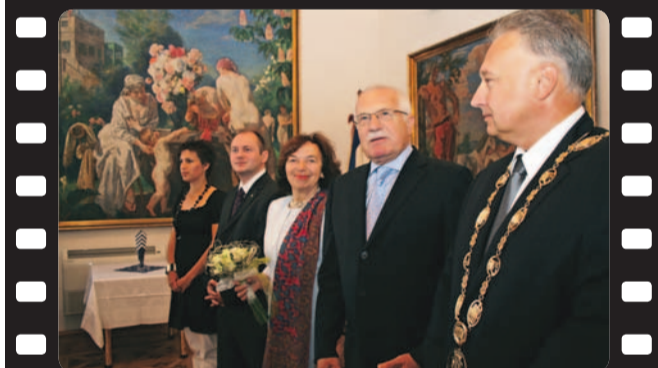
Návštěva hodonínské radnice a prohlídka památkové rezervace Plíže v Petrově