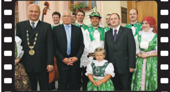
Ve Strážnici společně s tradičním folklorním sdružením