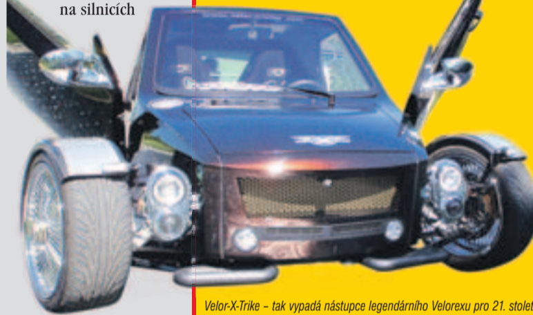
Velor-X-Trike – tak vypadá nástupce legendárního Velorexu pro 21. století. Vyrábí jej firma Motocoot, a.s., a to ručně. Každý vůz je tedy unikátem.

už od roku 1987, kdy jsme s tatínkem – vášnivým motoristou – přivezli tento stroj domů. Tehdy již na silnicích