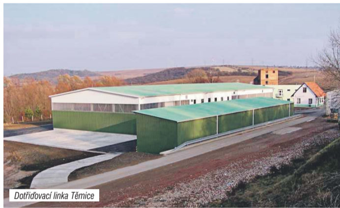
Dotřídovací linka Těmice

Podrobnosti vysvětluje Vlastimil Šunka, pracovník oddělení odpadového hospodářství, který má tuto problematiku na starosti. „S dotacemi z rozpočtu Jihomoravského kraje bylo za období 2005–2009 podpořeno celkem 57 projektů v celkové hodnotě 470 mil. korun. Z toho kraj poskytl dotaci téměř 41 mil., další prostředky byly čerpány