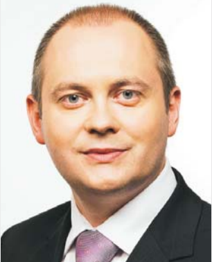
Mgr. Michal Hašek