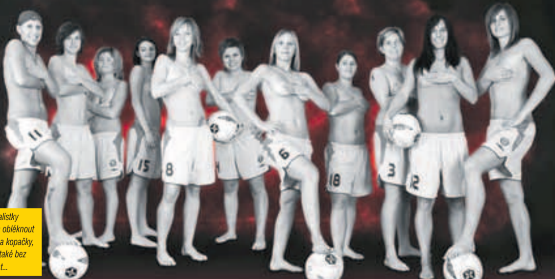
Brněnské fotbalistky dokážou nejen obléknout dres, trenérky a kopačky, ale téměř vše také bez ostychu sundat...

Zdrucující skóre 6:262 v prvoligové kopané za pouhou jedinou sezonu. I taková může být nejvyšší fotbalová soutěž. V tomto případě jde ale o ženskou první ligu a mužstvo z Ivančic v roli absolutního outsidera. Jinak je tomu u fotbalistek 1.FC Brno. Do sezony šly holky s ambicemi podobně jako muži ze stejného klubu. Chtěly prohrát Spartu, Slavii, Slovácko a skončit hned za nimi. Jenže realita je v obou případech jiná.